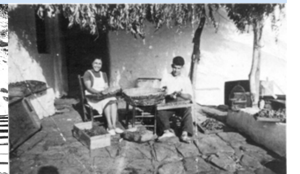
Tendiendo uvas en el pasero