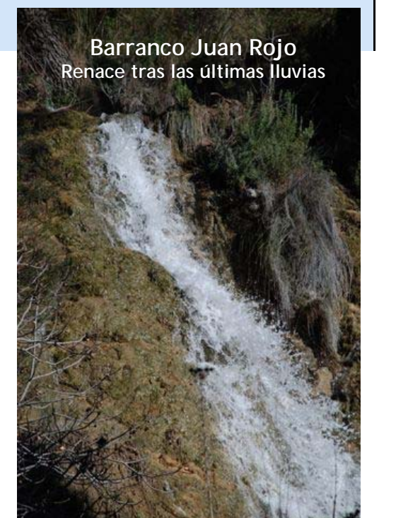
Barranco Juan Rojo Renace tras las últimas lluvias