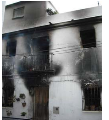
Estado en el que quedó la vivienda tras el incendio

Tras los sucesos acaecidos la noche del pasado día 2 de enero y ante la masiva respuesta de todos los compeños, tanto de los nacidos en Cómpeeta como de los foráneos, no queremos dejar pasar la ocasión que nos brinda La Voz de Cómpeeta para manifestar lo siguiente: