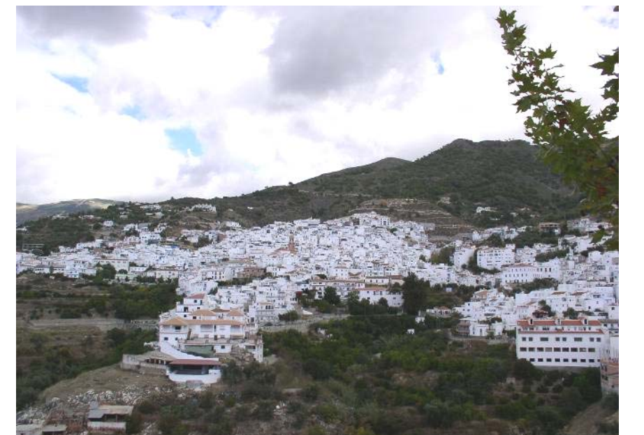
Cómpea en otoño